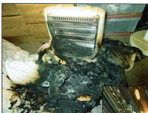
電気ストーブの輻射熱 ↑

ストーブの上方には空気対流が発生し、濡れていると動かなくても乾いて軽くなると煽られて落下します。ストーブ火災のほとんどは正面や周囲の燃えやすい物に着火しています。また、ストーブの輻射熱は想像以上に強く、特に電気ストーブは外出中や就寝中の火災が多く危険です。