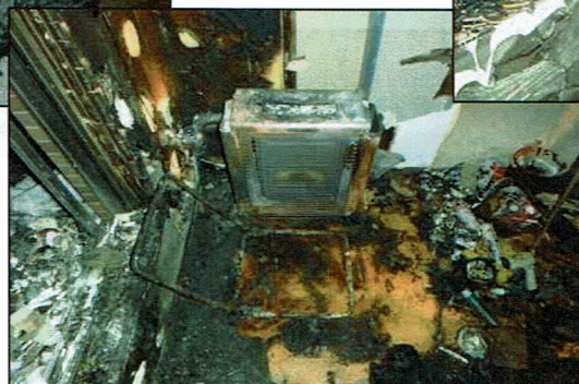
灯油ストーブ周囲に 可燃物 →