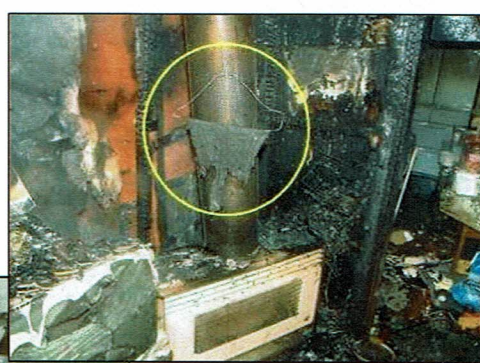
↑ 灯油ストーブ上方に洗濯物